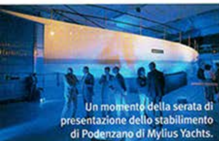
Un momento della serata di presentazione dello stabilimento di Podenzano di Mylius Yachts.